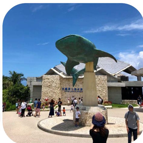
沖縄美ら海水族館