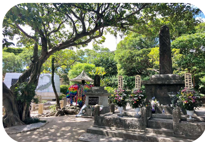
ひめゆりの塔 医療従事者の慰霊碑