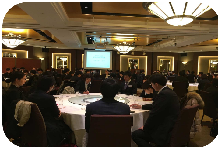
店長会議のご様子