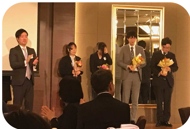
ご結婚お祝い花束贈呈のご様子